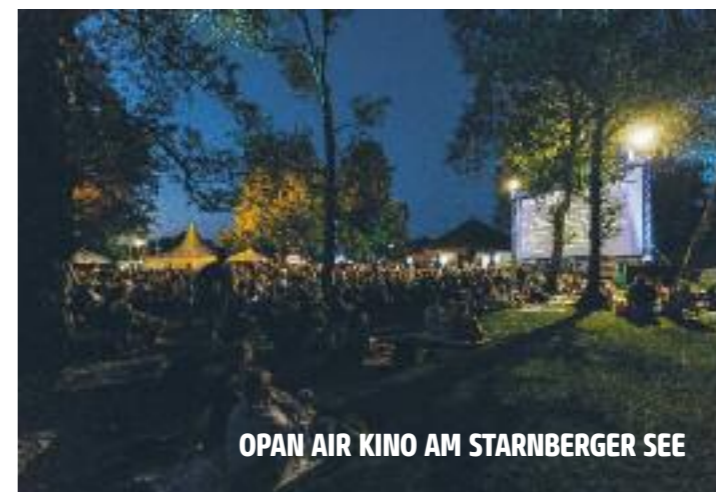
OPAN AIR KINO AM STARNBERGER SEE

SE 2018, 117 Min., FSK ab 12 Jahren Regie: Pernille Fischer Christensen Besetzung: Alba August, Trine Dyrholm, Maria Bonnevie