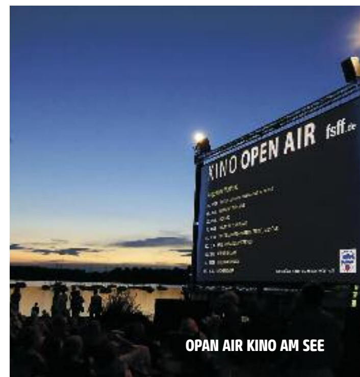
OPAN AIR KINO AM SEE

Eintritt: 8,- Euro Ü25 - Karte: 6,- Euro 5-Filme-Pass: 33,- Euro