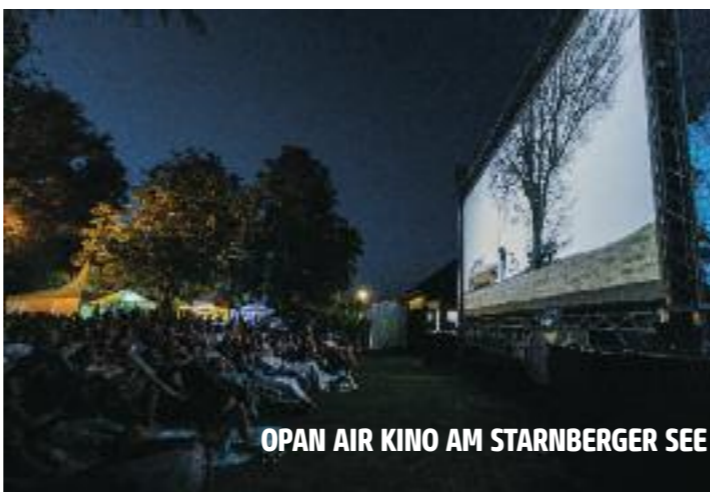
OPAN AIR KINO AM STARNBERGER SEE